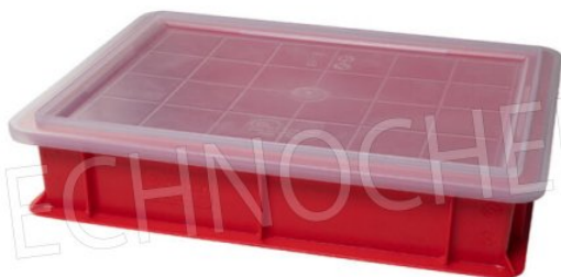
VAS010 ROSSO TRAFFICO + COPERCHIO TRASPARENTE 100002T